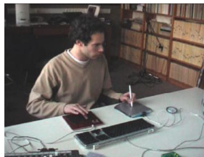
Exemple 3 : Instrument virtuel à synthèse par balayage.

Un instrument complet à synthèse par balayage a été réalisé 4 . Cet instrument permet de contrôler avec une tablette graphique Wacom 5 l'amortissement et la raideur de la corde (grâce aux méta-paramètres) ainsi que la fréquence fondamentale du son. Une surface tactile Tactex 6 contrôle la répartition des forces sur la corde. Le clavier permet de changer de configuration sonore, de lâcher la corde depuis une position initiale, de choisir de jouer un accord ou une note.